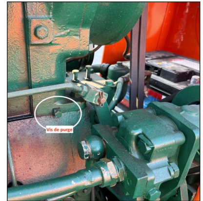
La vis de purge est à l'extérieur