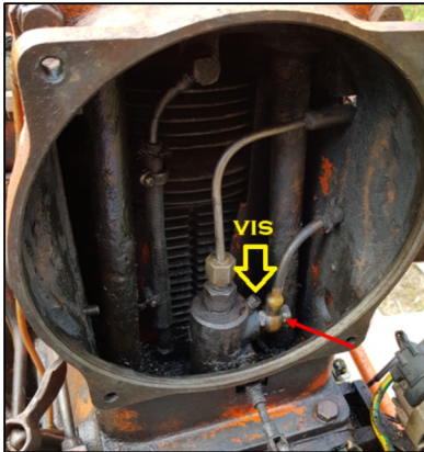
Avec ou sans vis de purge sur la pompe à injection (il faut déposer la turbine)