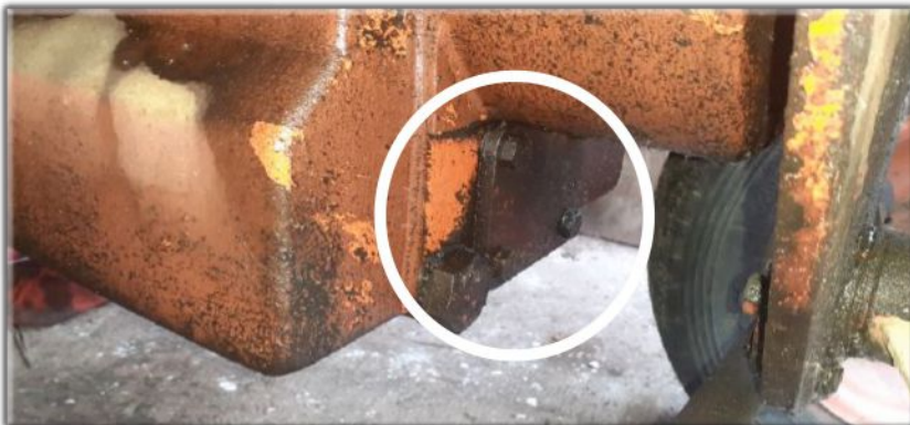
Dépose de la crépine