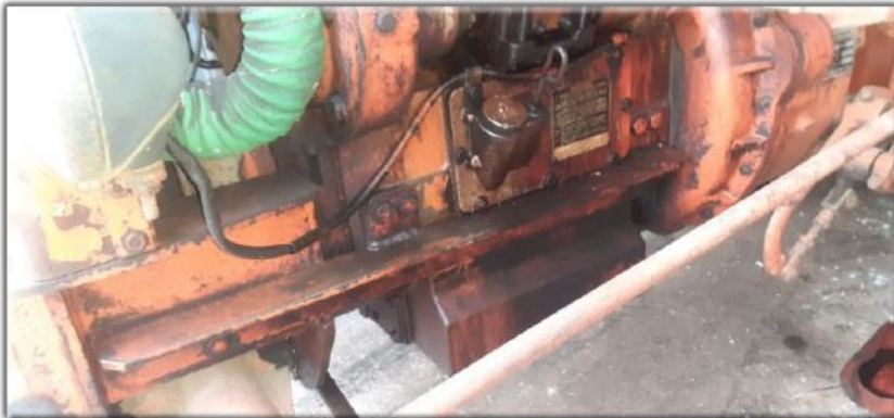
Vidanger votre carter d'huile moteur

Sur notre site de l'Amicale Vendeuvre dans « Les Informations Pratiques » une page est dédiée aux lubrifiants. Nous allons vous montrer pourquoi il faut procéder de cette manière pour ne pas risquer de détériorer la ligne d'arbre par un manque de graissage.