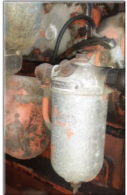
Démontage du filtre à huile ou le filtre à peigne

Sur les moteurs plus anciens le filtre à huile est à peigne il est actionné par un petit « robinet » qu'il faut tourner fréquemment pour effectuer son nettoyage.